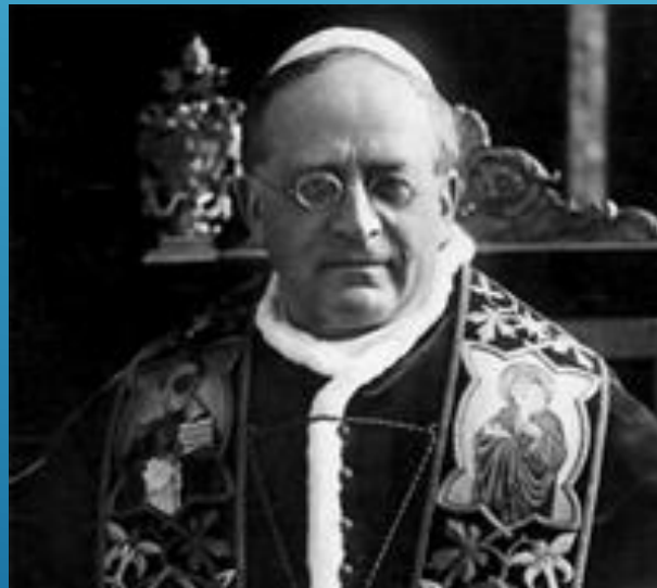
Papa Pio XI

”La política oportunamente ejercida, con preparación adecuada, intelectual, económica y social, es lo mejor, después del apostolado”